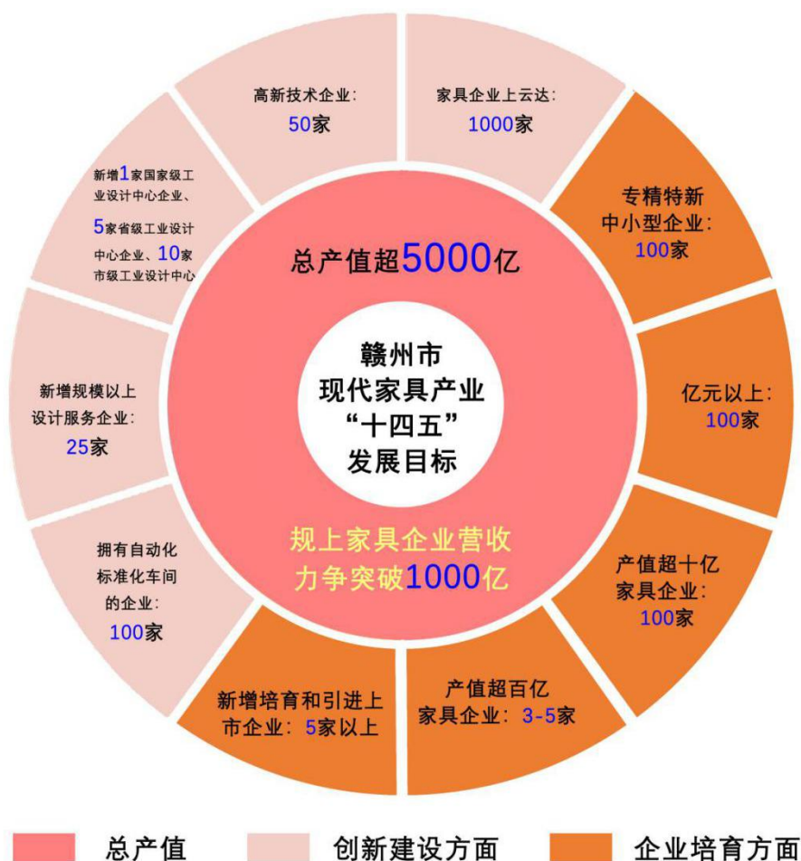
图 3-1 赣州市现代家居产业集群发展目标

在品牌目标方面： 打响“南康家具”品牌，持续提升“南康家具”集体商标品牌价值和知名度，培育“江西绿色生态”品牌 50 个；引进 10 家国际国内知名品牌企业总部落户赣州，建设全球现代家居总部经济区，培育自主品牌家具企业 1000 家；开展家具产品质量提升行动，培育一批“江西省井冈质量奖”及“赣州市市长质量奖”家具企业。