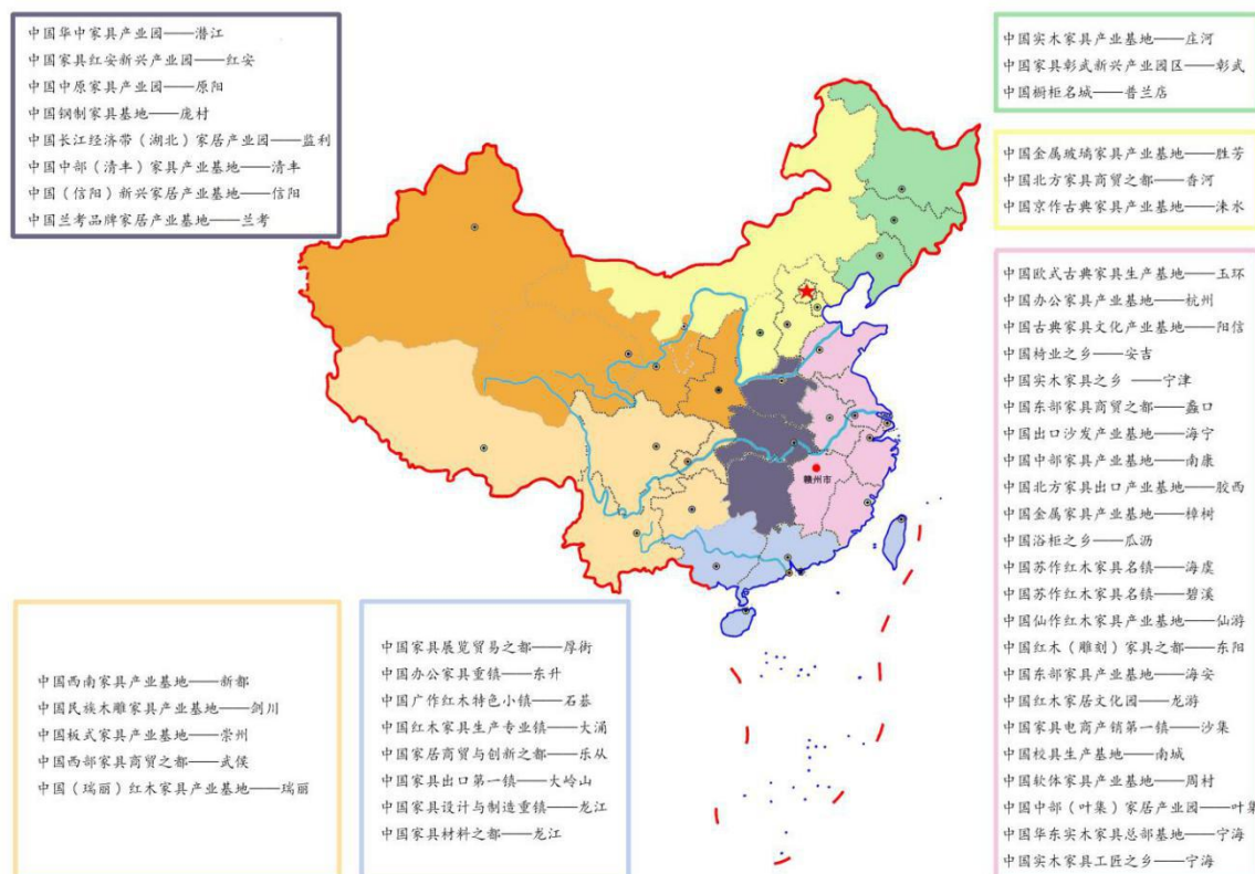
图 1-2 中国家具产区集群分布图

中国家具行业整体技术水平得到快速提升，大型家具企业发展趋势较好，规模以上家具企业的数量增多，盈利水平得到提高。国内主要核心产业集群，依托龙头企业，纷纷引入大规模定制化生产设备，改进生产工艺流程，将信息技术应用于生产制造，采用数字化管理技术，缩短了产品生产周期，提升了盈利能力，培育出一批掌握先进生产技术，细分市场占有率高，并具有一定国际影响力的头部企业。国内主要产业集群聚集区外的中小家具企业，由于缺乏核心技术，没有实现品牌化管理，导致抗风险能力较差，劳动生产率不高，盈利能力不强，逐渐萎缩或向周边主要生产聚集区转移。总体来看，家具产业在我国发展呈现不均衡特点。